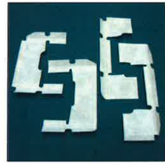
特殊絶縁紙の絞り加工事例