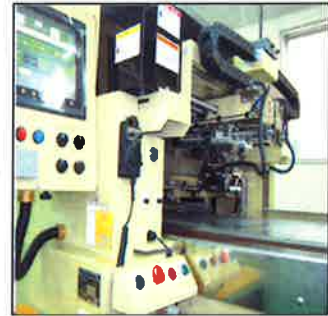
CCDカメラで位置決めを自動設定出来るプレス機